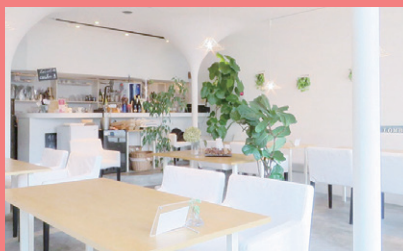
おしゃれな空間でおトクな情報を!

食ベログのカフェ部門で上位にランクインの人気カフェ。「天使の隠れ家」を思わせる真っ白な洞窟のような空間に、緑やお花がいっぱいのナチュラルなインテリアで、ゆったりした時間をすごせます。おしゃべり美味しいスイーツやフードで会話も弾むと、女子会にも人気のお店です。