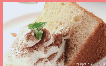
シフォンケーキの試食をご堪能ください!